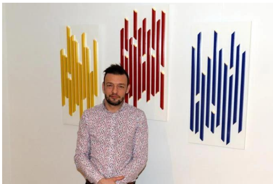
Figura 3 - Tom Vanhauwaert con la sua opera The Connections 3 .

In questa citazione riportata come accompagnamento all'opera emerge la presenza di una certa componente "rigida", razionale e studiata, limitata appunto da linee e regole. La controparte, invece è mossa dal cuore e dai sogni. Essa corrisponde al nostro Io, la nostra parte più irrazionale. In quest'opera i dos mundos convivono, si relazionano l'uno con l'altro, unendosi all'apparenza in maniera contrastante, ma profondamente complementare. La scultura, come ci ha raccontato l'artista stesso, simboleggia un cuore, o meglio, la sezione di un cuore. Questo simbolismo viene manifestato dalla presenza del colore rosso vivo, colore ricondotto spesso al cuore o all'amore, ma questo contiene anche un nucleo dorato formato da tanti riquadri uniti tra loro. Questa, ci viene detto, è la rappresentazione di un cuore ricco di amore, per sé stesso e per gli altri. Tom Vanhauwaert è uno di quegli artisti per i quali le emozioni, le idee, i sentimenti e i principi sono i fattori più importanti da infondere alla propria opera. Non esiste interesse per i beni materiali, per i beni superficiali e per la felicità effimera. Si ricava quindi che l'uso dell'oro è puramente simbolico: si vuole indicare ciò che ci sia di più caro nella vita utilizzando un colore, un elemento prezioso a livello materiale, ma svuotandolo di questa caratteristica.