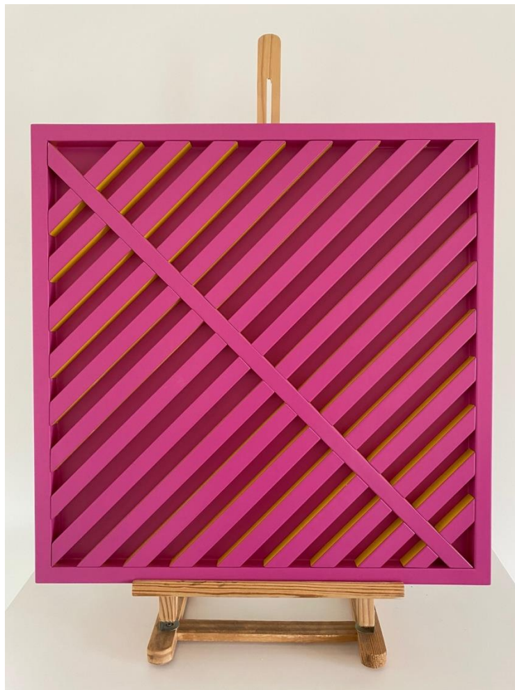
Figura 5 - Kinetic / Pink Barbie in a Yellow Cab, Tom Vanhauwaert, 50x50 cm

“La mia ancora di salvezza è nascosta nelle mie opere. Naturalmente ognuno può vedere le proprie cose. Osare guardare la vita in modo diverso è importante.” 3